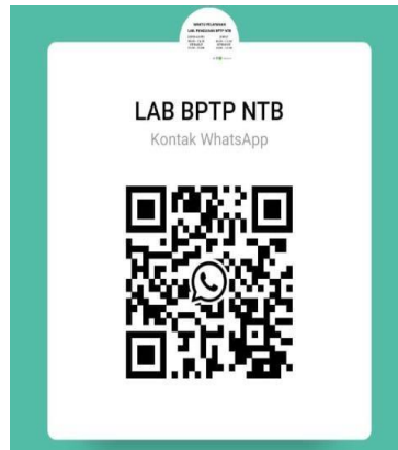
Gambar 2. QR code kontak Aplikasi Android Whatsapp untuk kontak CS LP-BRMP NTB https://wa.me/qr/GM4A3UX6PCP4J1

tanah/pupuk/tanaman dapat diantar langsung atau dikirim melalui jasa pengiriman, demikian pula dengan pembayaran dapat di transfer ke rekening BRMP NTB.